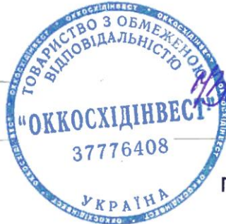
Загорівська І.К. Головний бухгалтер